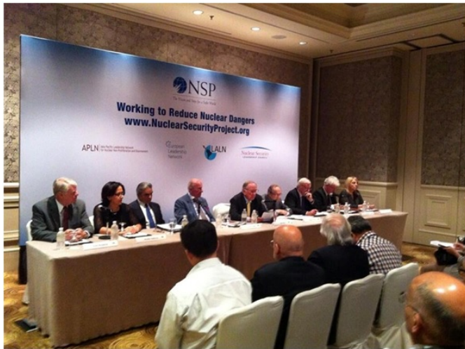
Fundación NPSGlobal, 9 dic 2013.

Líderes de América Latina y el Caribe en una reunión global sin precedentes en Singapur se han comprometido a hacer su parte para dar un nuevo impulso a los esfuerzos globales para reducir los crecientes riesgos nucleares. A la vez advirtieron que un incidente nuclear en cualquier lugar del planeta tendría consecuencias catastróficas para todos, incluyendo a los 580 millones de habitantes de la región de 33 países.