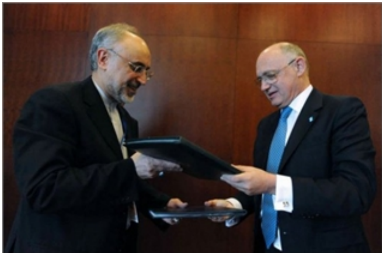
Fundación NPSGlobal, 3 mar 2014